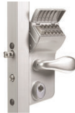
Serrure à code mécanique