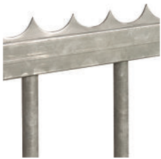
Lisse défensive rivetée sur le portail